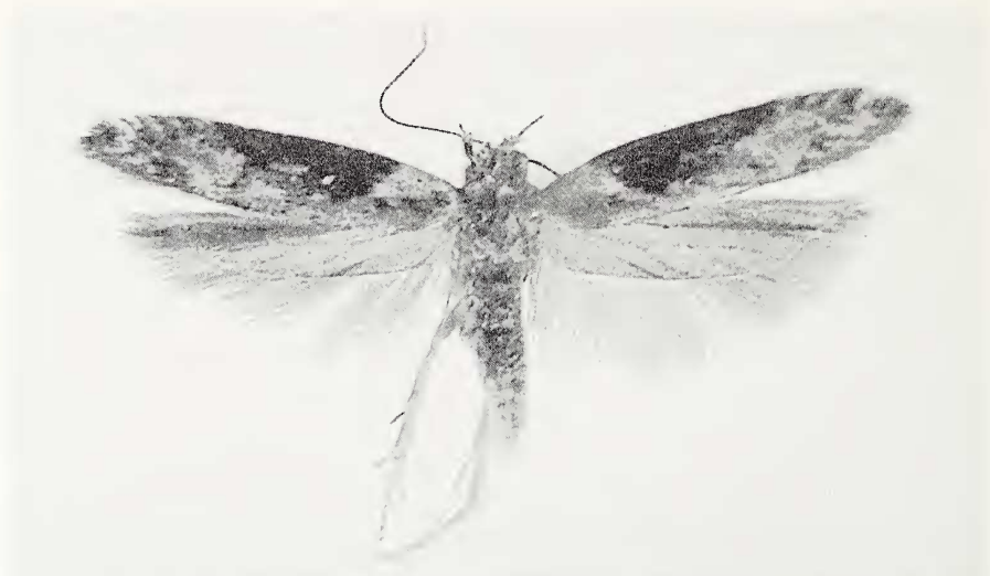
Figuur 1: Scrobipalpa costella (Humphreys & Westwood, 1845), België, Oost-Vlaanderen, Zwijndrecht, 18.VIII.1977, leg. B. Maes.

verandert, laat ze nogal wat sporen na op de plant. Ze kan aangetroffen worden van midden september tot mei van het daaropvolgende jaar. De verpoping vindt plaats tussen enkele samengesponnen bladeren of in de stengel (Stainton 1867: 80, Jansen 1999: 53). De volwassen vlinders werden waargenomen vanaf einde augustus tot in juni van het volgende jaar. De soort komt bij voorkeur aan bosranden voor (Elsner, Huemer & Tokár 1999: 44). In Nederland wordt S. costella echter uitsluitend in de kustgebieden aangetroffen (Jansen 1999: 56). De vondst bij Zwijndrecht sluit daar goed bij aan.